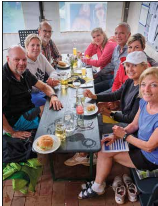
Die Mömbriser Teilnehmer am Hopman-Cup in Blankenbach

Hop-Man-Cup 2024: Die DJK ist nach 2018 wieder mit der Ausrichtung dran. Da gilt es schonmal Daumen für besseres Wetter zu drücken!!